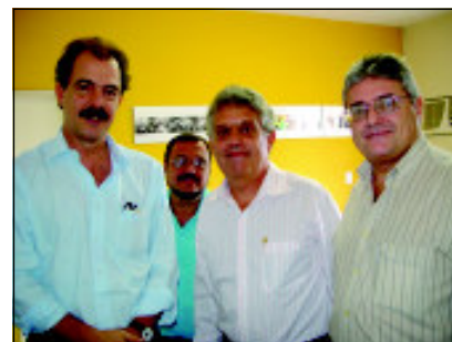
Mercadante, Francisco Oiring, Osvaldo Passadore e Renato Becker: iniciativas para impedir a privatização

No dia 13 de março, o Sindicato dos Engenheiros de São Paulo e a AECESP se reuniram com o senador Aloísio Mercadante (PT-SP) e conseguiram um importante aliado na tentativa de impedir a mudança no contrato de concessão da Empresa. Uma das iniciativas do senador foi marcar uma audiência com a Aneel para discutir o assunto.