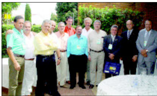
Dirigentes de entidades representativas participaram do evento em Bauru

No dia 27 de março, sob o tema “Energia”, a cidade de Bauru (SP) foi palco da abertura do projeto “Cresce Brasil”, uma série de seminários que o Sindicato dos Engenheiros no Estado de São Paulo (SEESP) promoverá até agosto em cinco cidades do interior paulista. O objetivo é oferecer à sociedade as bases para um plano nacional de desenvolvimento.