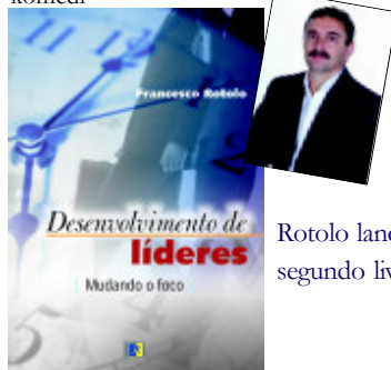
Rotolo lança segundo livro

Vendas” - apresenta dicas, conceitos, técnicas e ferramentas para aprimorar a formação de vendedores.