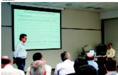
O impacto da norma nas atividades do setor foi o tema da palestra