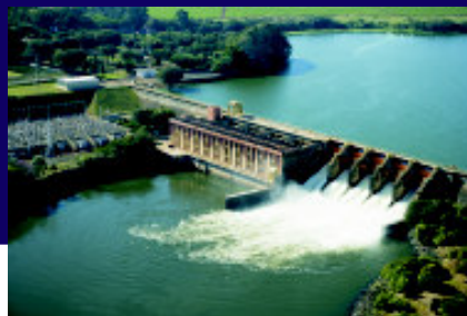
Barra Bonita: reflorestamento nas margens do reservatório.

No dia 21 de setembro de 2007, a Convenção-Quadro das Nações Unidas relativa às Alterações Climáticas (UNFCCC), por meio da Junta Executiva do Mecanismo de Desenvolvimento Limpo (MDL), aprovou o Projeto de Florestamento e Reflorestamento das Áreas de Proteção Permanente no Entorno dos Reservatórios, desenvolvido pela AES Tietê.