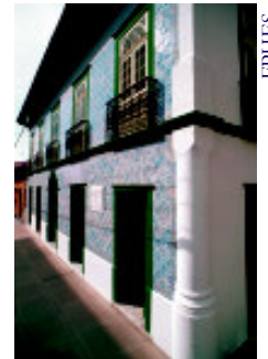
Museu da Energia de Itu