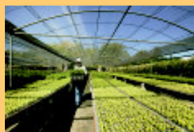
Viveiro de mudas da AES

A metodologia compreende o plantio de aproximadamente 16 milhões de mudas, de um mínimo de