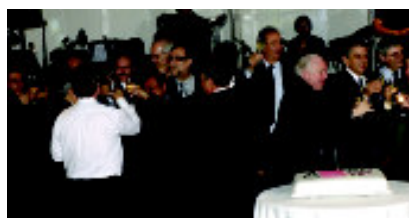
Um brinde pelos 40 anos da AECESP