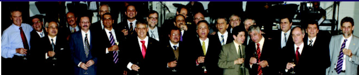
Dirigentes de todas as épocas prestigiam o evento

Mais do que um simples aniversário de fundação, o 40º Baile da AECESP foi realizado num clima especial. A sua história foi o destaque, reavivada no encontro de dirigentes de várias gerações, na fala dos premiados e homenageados, nas imagens apresentadas no telão e na extensa lista de convidados, que testemunharam a força de uma entidade que completou 40 anos em defesa da categoria.