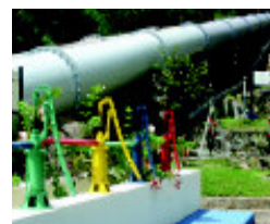
Aduadoras: ação mecânica da água para gerar energia.