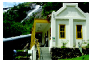
Visitação pública com finalidade educativa e cultural

Pela primeira vez, a Aneel recebeu pedido de uma instituição que solicita concessão para gerar energia elétrica sem fins lucrativos. E o caso tornou-se ainda mais singular por se tratar de um projeto onde a história gera recursos para alimentar a própria história - uma espécie de moto-contínuo, necessário para não deixar cair no esquecimento a saga dos nossos ancestrais.